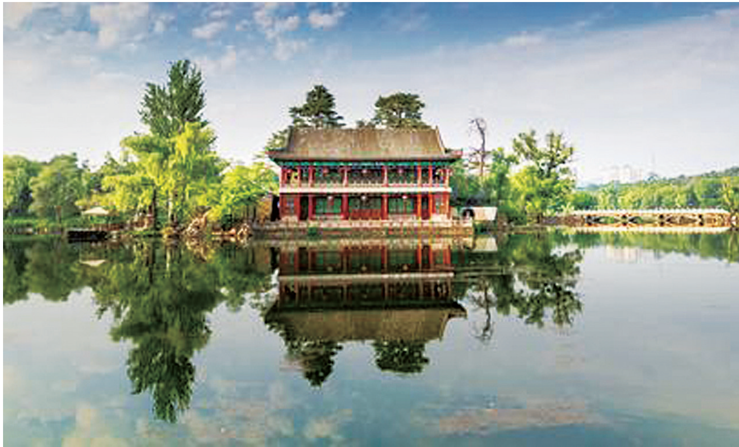
烟雨丽影

阿房宫奢,羽之一炬,铜雀台糜,民愤天摧,明宫叹惋,毁于兵燹,惟兹夏都,和合永固,承恩德泽,传褒仁惠。一座山庄,半部清史,皇家故宫,世界文遗,千秋流芳,万古颂扬。