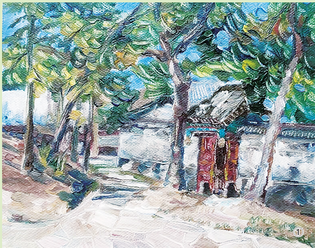
① 般若相前的林荫路 ② 国色牡丹园 ③ 登绮望楼