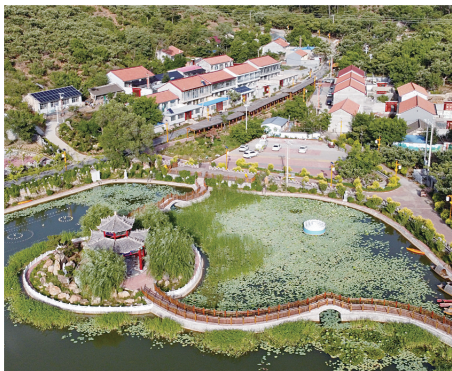
近年来，宽城统筹推进农村人居环境整治提升工作，通过公共基础设施改善、乡村产业发展、乡风文明进步等相互促进，逐步推进小游园、小菜园、小花园、小果园的农村“小四园”建设，全力打造美丽宜居乡村。图为宽城村梨台镇存村焕然一新的村容村貌。

强化重点涉水企业执法检查。严格落实“一厂一策”，以阴河、西路嘎河流域淀粉加工企业为重点，实施技改升级，不能达标排放的一律不得复产。加强企业执法检查，成立流域治理执法专班，市、县、乡三级执法，“一对一”驻企包保，实施24小时监督，对阴河流域57家蔬菜清洗企业发放水体污染防治告知书，对存在违法行为的企业取缔关停。