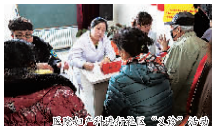
医院妇产科进社区“义诊”活动